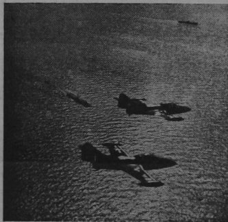
Under hammering by the combined air and sea might of United Nations forces, Communists in Korea have suffered staggering losses in men and material. — The United States of America's Fast Carrier Task Force 77 is concentrating on striking at behind-the-line bridges and communication networks to cut off Communist supplies, besides lending close support to United Nations forces in the front lines. — Two F-9-F Panther jet airplanes are shown returning to the decks of aircraft carriers, as a destroyer stands by.

Jamaica Gleaner — Jamaica Times — Chicago Defender Trinidad Guardian, etc. For Sale at Dixon's Barber Shop. West of the Limon Market.