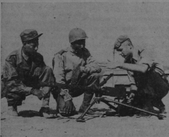
Un soldado neerlandés (a la derecha) instruye a miembros de la infantería etíope en el manejo de una máquina liviana de guerra calibre 30, en un campo de adiestramiento en Corea.